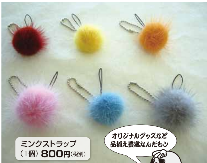
ミンクストラップ (1個) 800円 (税別)

ミンクを使用した加工品を製造・販売しています。 また、地元紋別にちなんだ他にないオリジナル商品 を多数取り扱っています。