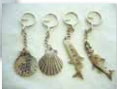
メタルホルダー (1個) 500円 (税別)