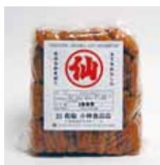
天ぷらかまぼこ (1kg入) 1,300円