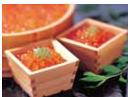
いくら醤油漬け(冷凍)