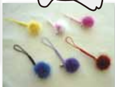
ミンク根付 (1個) 300円 (税別)