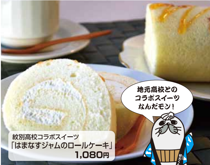
紋別高校コラボスイーツ 「はまなすジャムのロールケーキ」 1,080円

「お菓子の傍らには笑顔がある」をモットーに地元とともに歩んで50数年。北海道産、地域産、地場産にこだわり、素材の持ち味を十分に引き出した味でお客様の笑顔に応えます。