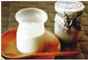
道産牛乳・チーズ・生クリーム使用 「白いプリン」 (1個) 267円