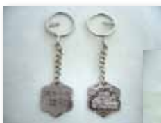
ガリンコ号 メタルホルダー (1個) 600円 (税別)