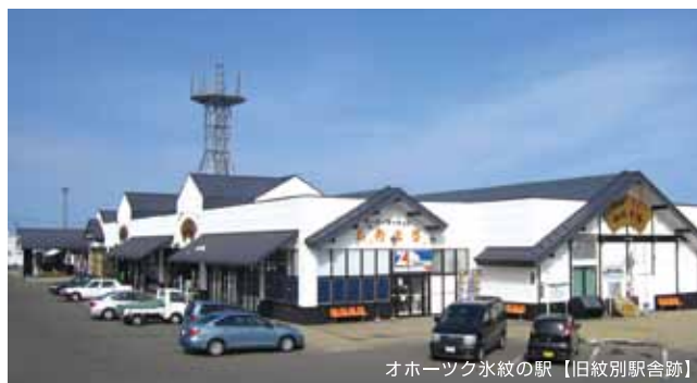
オホーツク氷紋の駅【旧紋別駅舎跡】

頭に乗っているのは大好物のホタテだもん。気分によってイクラやカニの爪、鮭なんかも乗せるんだ! あざらしだから寒さには強いけど、お腹だけは冷えないように腹巻が欠かせないんだもん。自慢の半被は流氷をイメージしたデザインなんだよ! お祭が大好きで、祭があればどこへでもかけつけて盛り上げるもん!