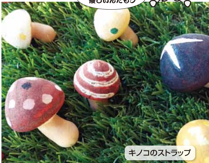
キノコのストラップ