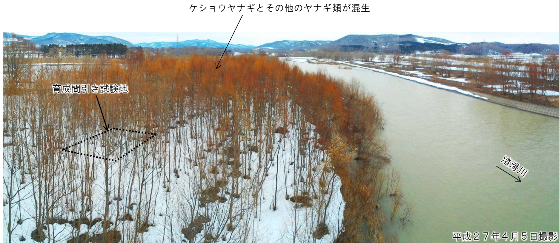
よつ葉大橋から上流を望む