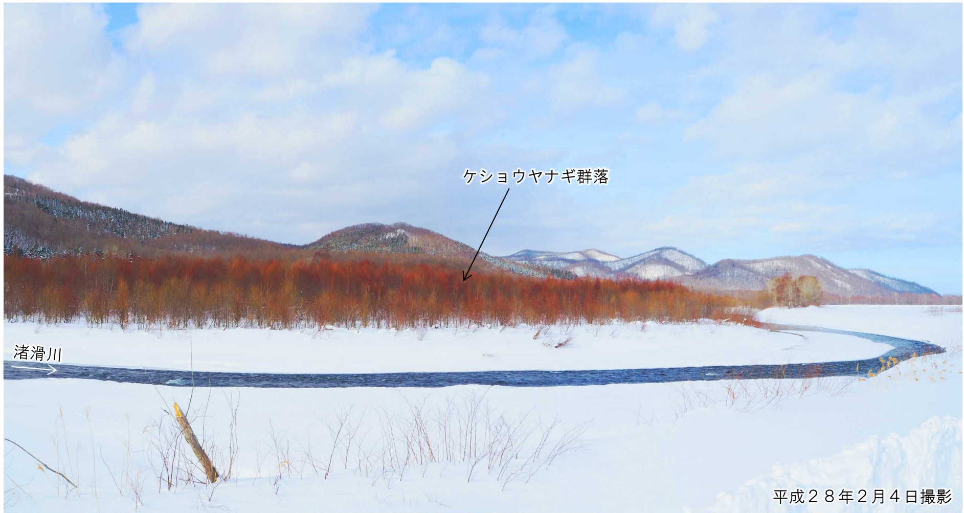
K P 1 4 . 6 右岸から左岸を望む